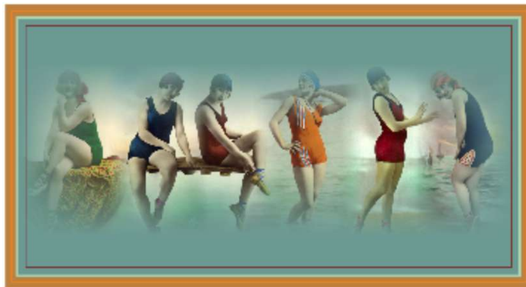
PAÑUELO PLAYA VINTAGE