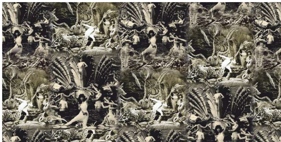
PAÑUELO CINEMA NOIR