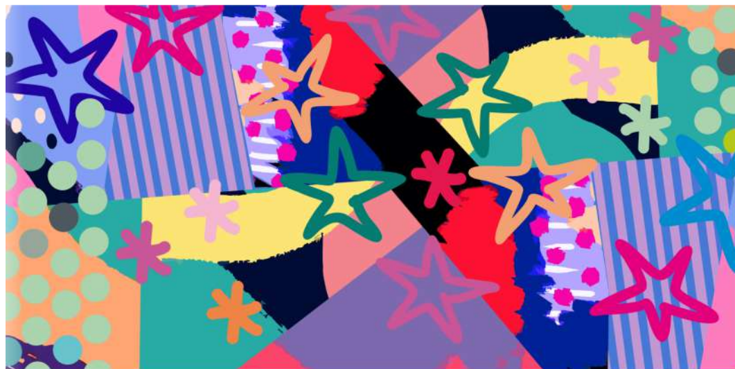
PAÑUELO JUMP ESTRELLA