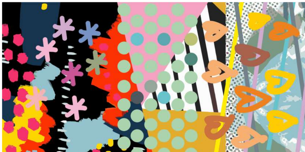
PAÑUELO JUMP CUORE