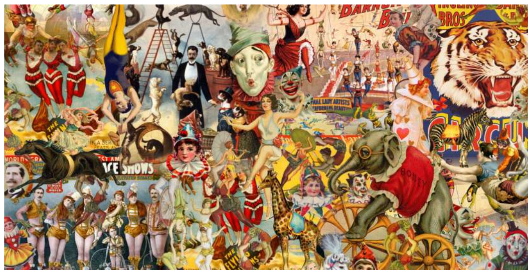
PAÑUELO CIRCO VINTAGE