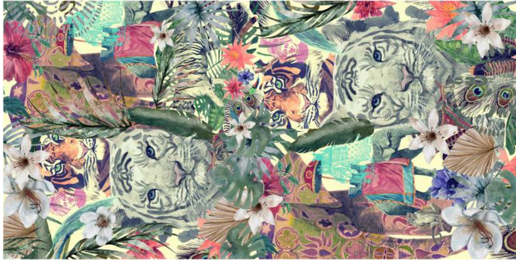
PAÑUELO HOLI INDIA