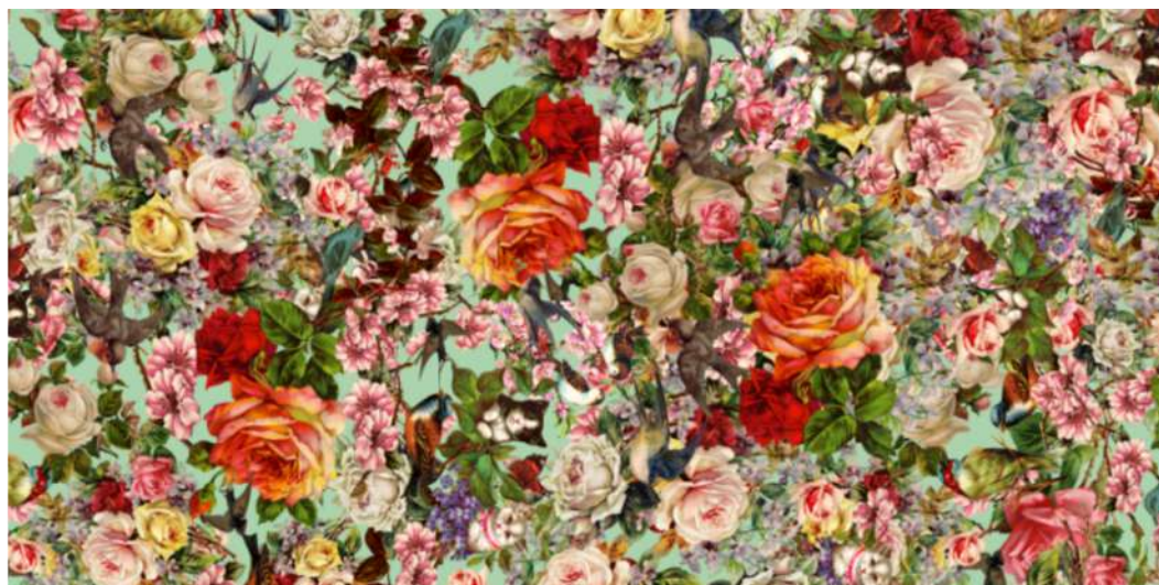
PAÑUELO PÁJAROS Y FLORES