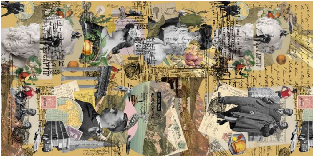
PAÑUELO COLLAGE TRAVEL