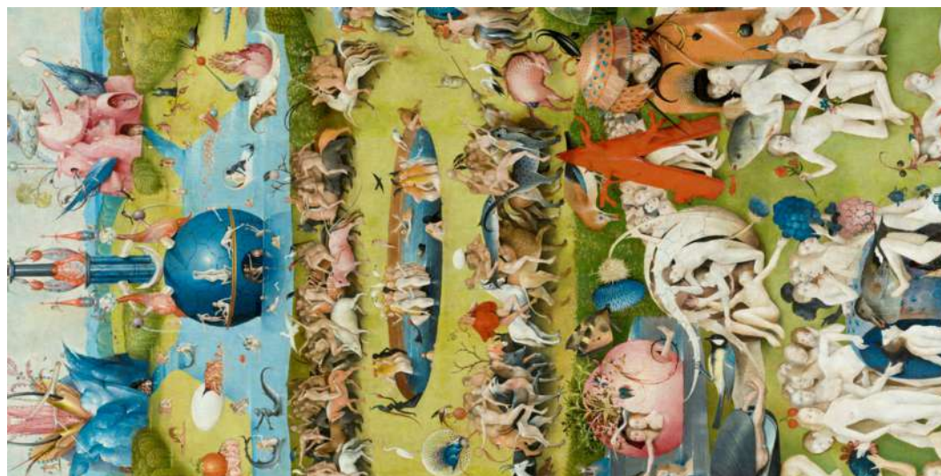
PAÑUELO JARDÍN DELICIAS