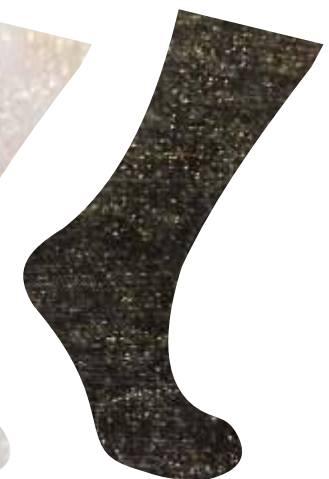
NEGRO + ORO