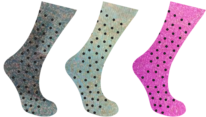
AZUL PATO + ORO