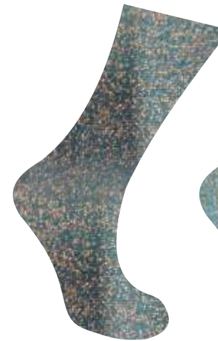
AZUL PATO + ORO