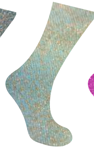
AZUL CIELO + ORO