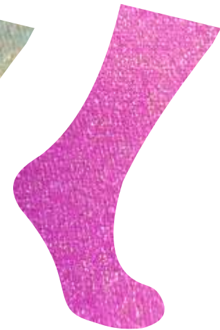
ROSA + ORO