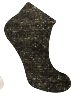
NEGRO + ORO