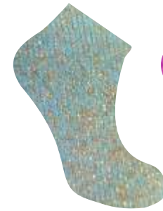
AZUL CIELO + ORO