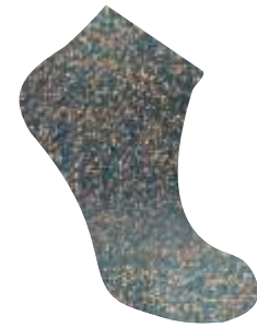
AZUL PATO + ORO