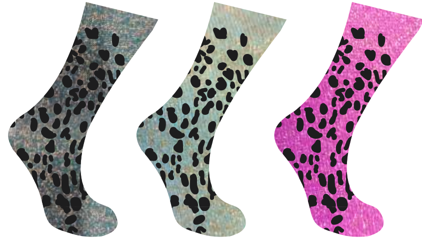
AZUL PATO + ORO