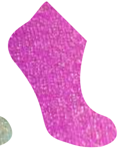
ROSA + ORO